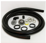
Kit de passe-cloison pour tonneau en plastique