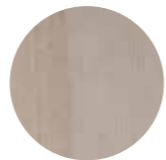
Sisäpinta Cello Light