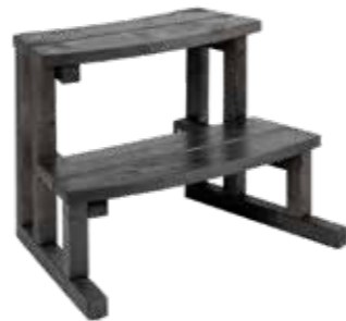
STEPIN RAPPUSET 502047356